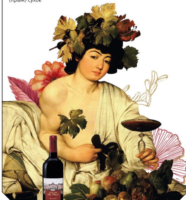
Микеланджело Меризи де Караваджо, «Вакх», 1596