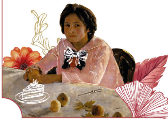
В. Серов, «Девочка с персиками», 1887