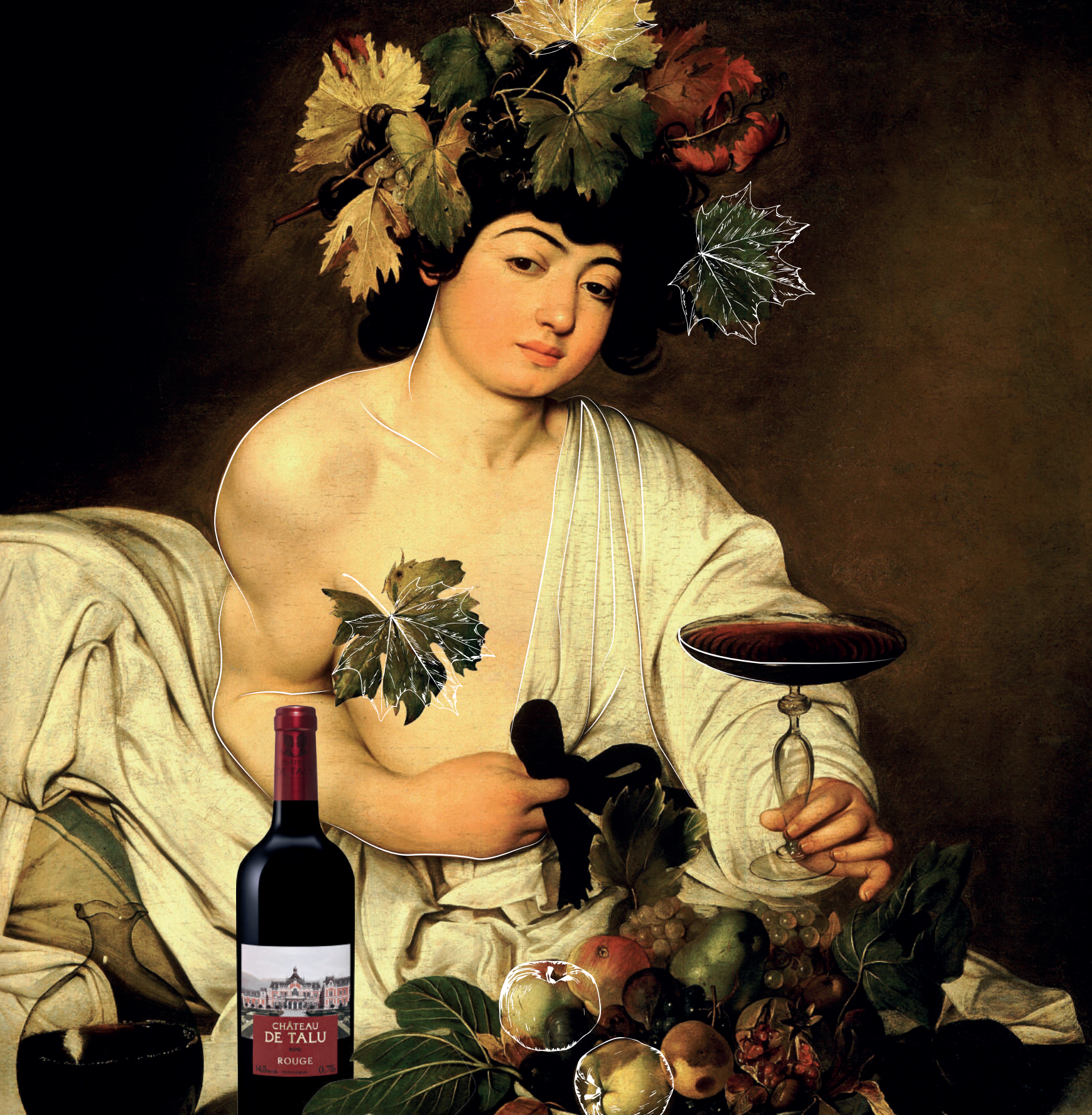
Микеланджело Меризи де Караваджо «Вакх», 1596