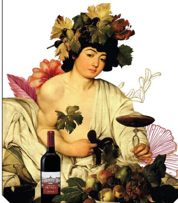
Микеланджело Меризи де Караваджо, «Вакх», 1596